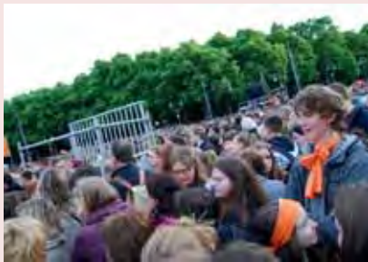
bike & help als Lutherroute zum DEKT DEKT Berlin/Wittenberg Abschlussgottesdienst in Wittenberg