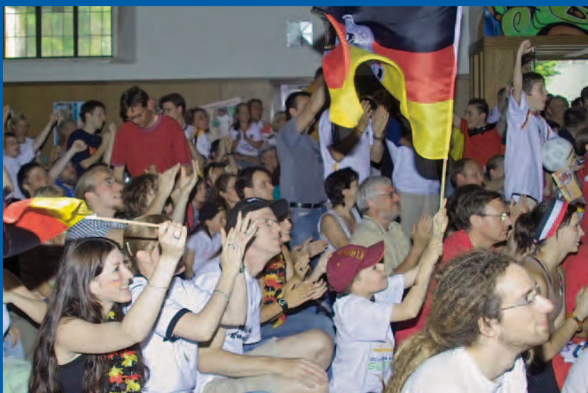
Kleine Kirche während der WM 2006: Volles Haus und Riesenstimmung beim Public Viewing

(Red.) Im Juni ist es wieder so weit: es ist EM! In Polen und der Ukraine rollt der Ball und in der „Kleinen Kirche“ in Kaiserslautern wird jeder Spieltag des deutschen Teams ein Event. Die Evangelische Jugend lädt alle zum Public Viewing ein, zum Mitfiebern mit dem deutschen Nationalteam, ebenso