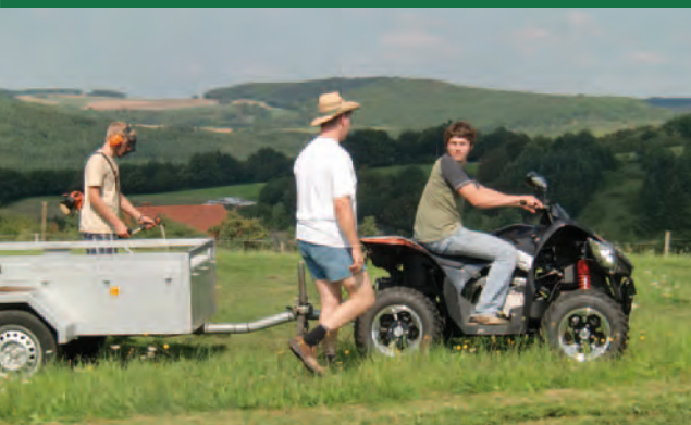
Impression von Dorf-Leben 1 in Katzenbach

6 Uhr, Warnschilder weisen auf die werktäglichen Sprengzeiten hin. Die Bahn taktet im Rheinland-Pfalz-Takt und die Pendlerströme auf der B 270 tun ihr Übriges zur Strukturierung der Zeit im Dorf.